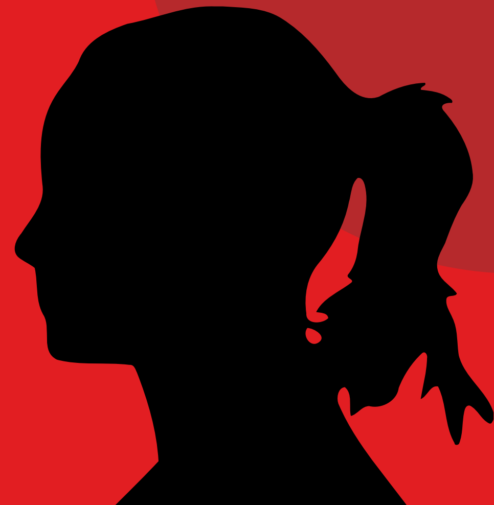
Madame O. Maîtresse de maison depuis 2005